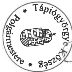
Fehér Henrietta polgármester