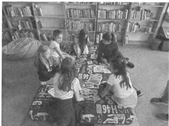
Szabadulj ki a könyvtárból

A tápiógyörgyei faluújság szerkesztése is a mi felelőségünk, évente 5 szám jelenik meg.