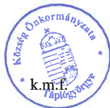
Fehér Henrietta polgármester

Ha nincs akkor Tápiógyörgye Község Önkormányzatának Képviselő testületi ülését 18 óra 56 perckor lezárom.