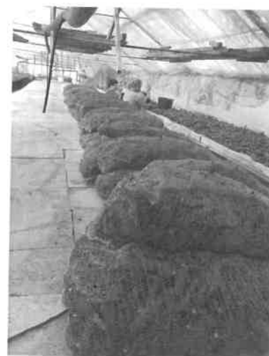
9. kép Fűszerpaprika