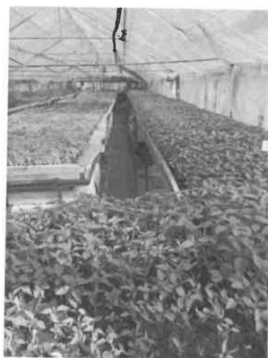
12. kép Fűszerpaprika