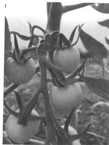
6. kép Paradicsom