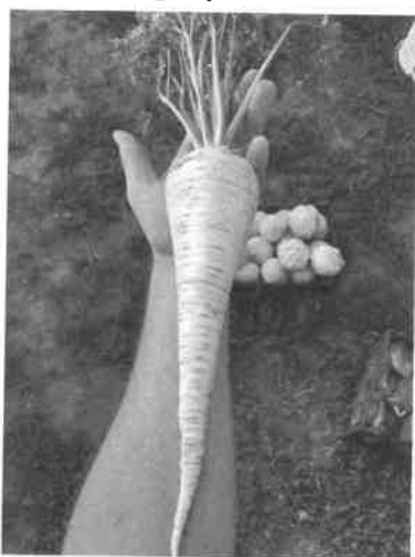
8. kép Petrezselyem