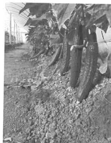
10. kép Kígyóuborka