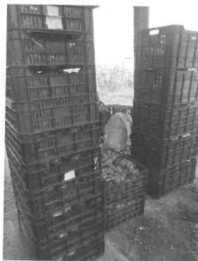
11. kép Beszállítás a Konyhára