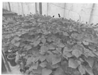
3. kép Szalvia