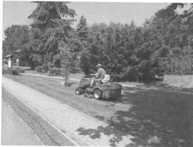
1. kép Fűnyírás a parkban