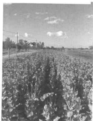
13. kép Mák