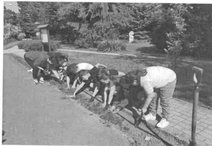
2. kép Virágpalánta ültetés az iskolások segítségével