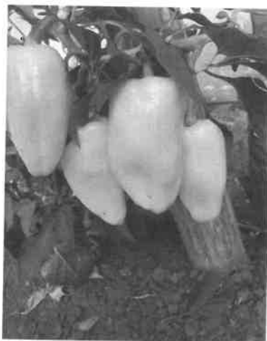
7. kép TV-paprika