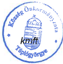
Fehér Henrietta polgármester